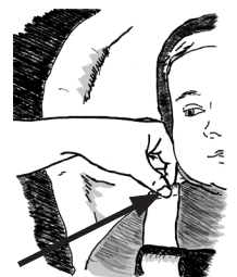
C. Use la prueba del pellizco. Si puede pellizcar una correa, está demasiado flojo.

Ajuste las correas del arnés ceñidamente. No debe estar capaz de pellizcar una flojera (C). No vista al bebé en cobijas gruesas ni ropa pesada. Si lo hace, puede que el arnés no proteja al bebé en un choque. Cuando hace frío abroche primero el arnés y después cubra al bebé con una cobija.