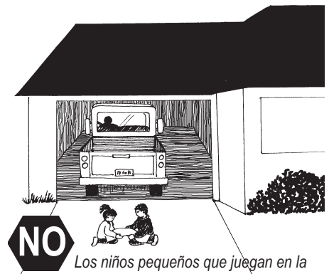
Los niños pequeños que juegan en la entrada del garaje corren peligro de un vehículo que de marcha atrás.

Siempre tome de la mano a su hijo mientras camina, cruza la calle, y en lotes de aparcamiento.