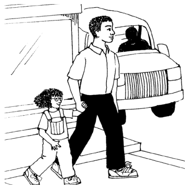
Tome la mano de un niño cuando cerca de las calles o en un aparcamiento.

Sea cauteloso en las calles de la vecindad o cerca de las escuelas y lugares de juego. Siempre deténgase cuando vea buses escolares con luces rojas parpadeantes. Trabaje con los vecinos para disminuir la velocidad del tráfico en las calles locales.